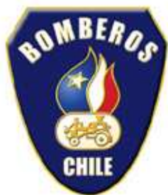
TABLA PARA SESIÓN EXTRAORDINARIA DE DIRECTORIO N° 333 DE 24 DE MAYO 2008